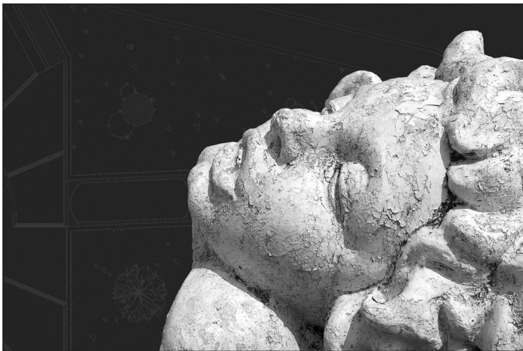
Las caras del zodiaco 1 , del proyecto "Reinterpretación del espacio público".