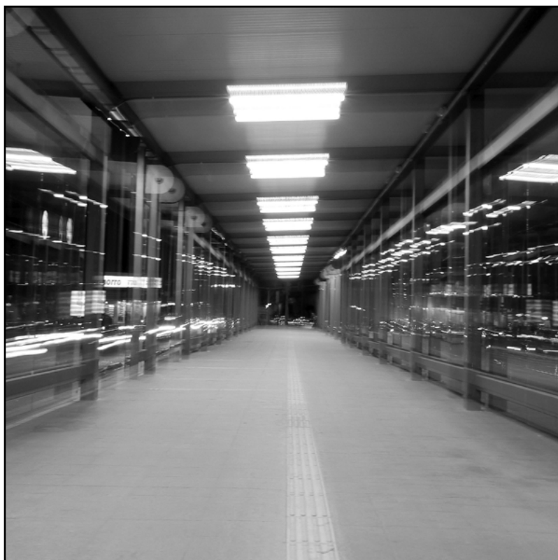
Sin título (detalle), José Luis Sánchez.