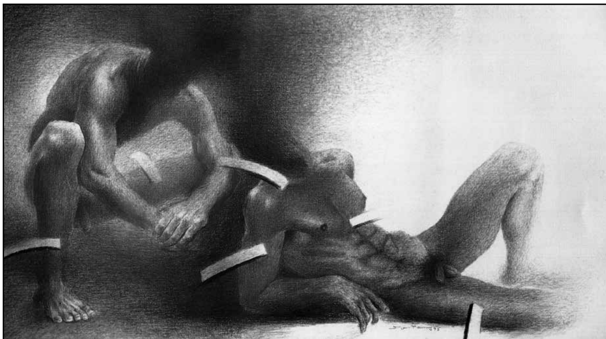
Desnudo II, sanguina / papel, 91 x 56 cm.