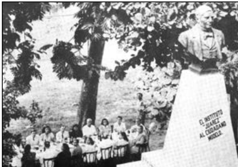
Patio central del Instituto Juárez. Comida de maestros del Instituto Juárez con el candidato a gobernador: Lic. Francisco J. Santamaría. 1946.

esta información viene de dos grupos principalmente, Televisa y Tv Azteca?