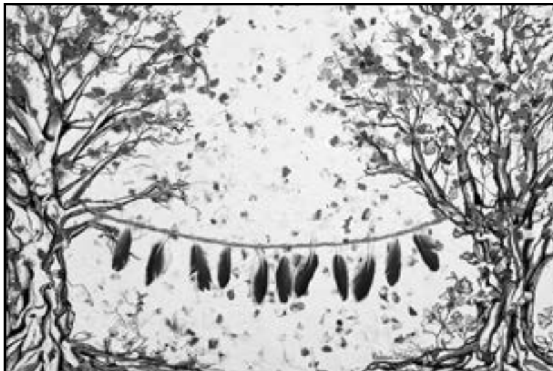
Secando el vuelo II.

impactar positivamente tanto en la formación de los estudiantes y en sus posibilidades de titulación, como en los indicadores institucionales; en esta descripción destacamos los siguientes: