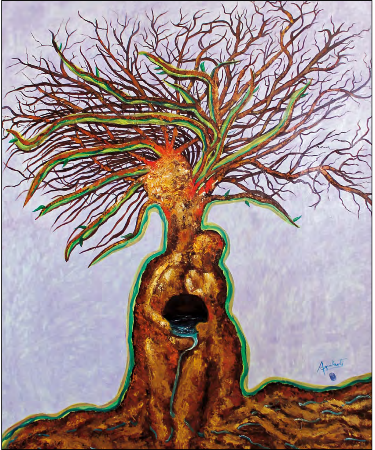
Madre naturaleza. Óleo sobre tela, 100 x 80 cm.