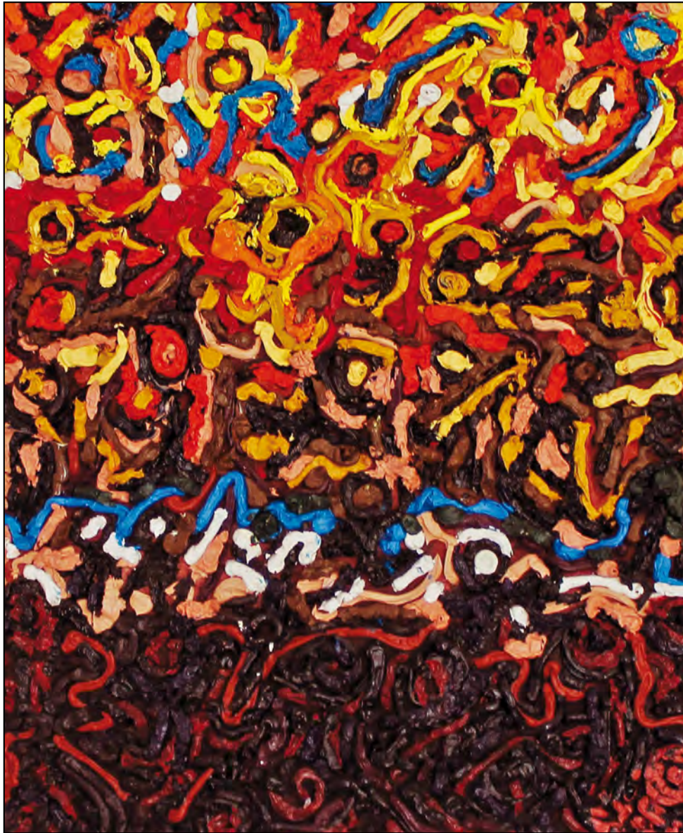
Mirame. Óleo sobre tela, 52 x 43 cm.