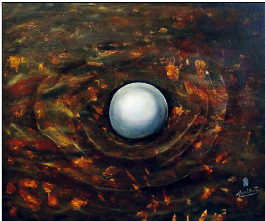
La perla. Óleo sobre tela, 60 x 50 cm.