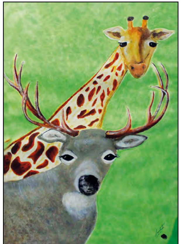
Libertad. Acrílico, 50 x 35 cm.