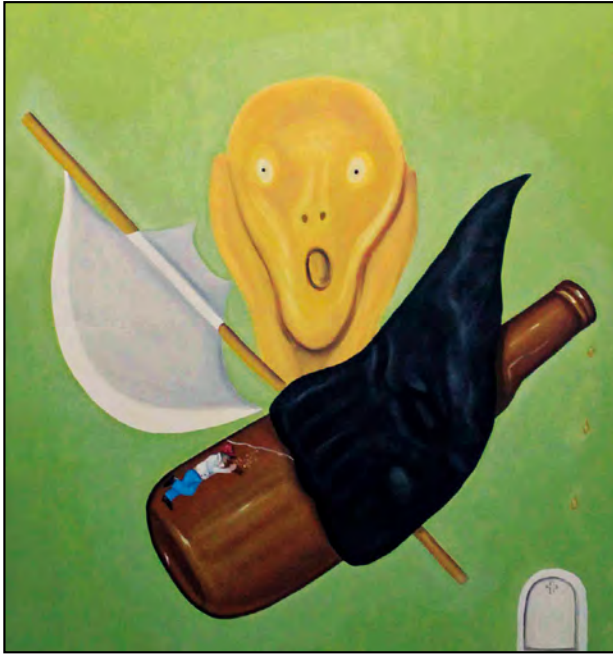
La vida es más que una botella. Óleo sobre tela, 120 x 100 cm.