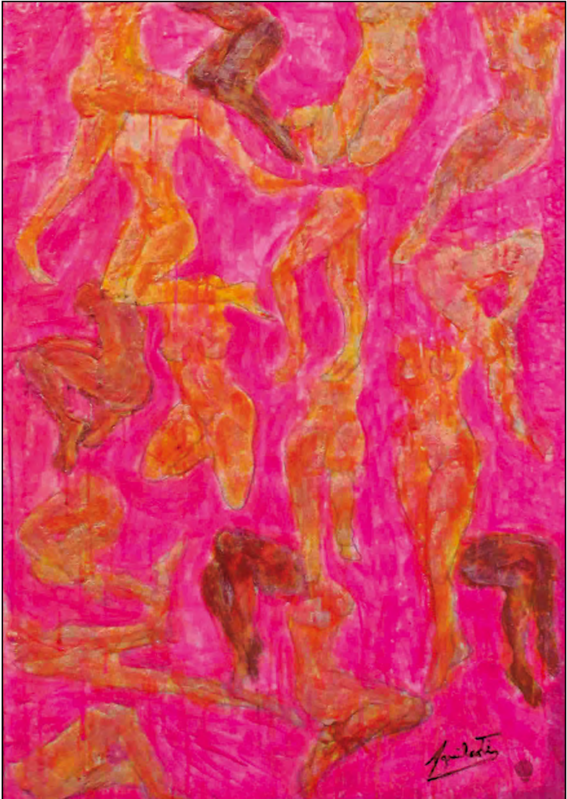
El enredo de las Piernas. Óleo y cera sobre tela, 50 x 35 cm.