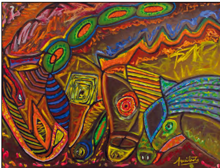
Carnaval equino. Óleo sobre tela, 60 x 85 cms.