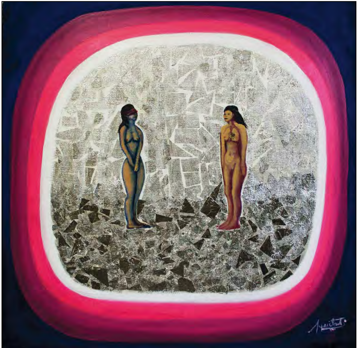
El yo interno. Óleo sobre tela, 60 x 60 cm.