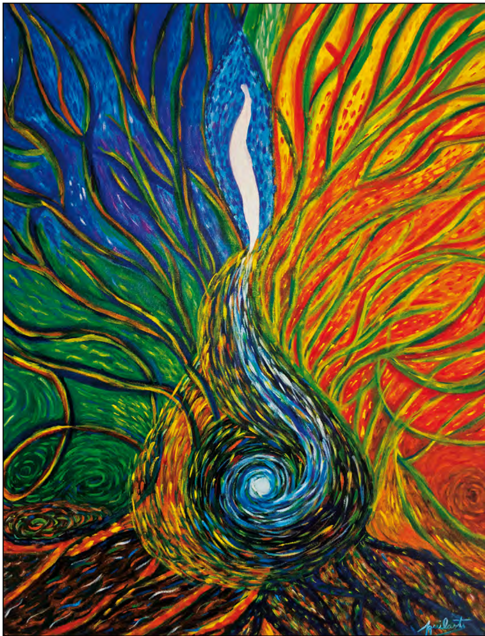
Expresión del alma. Óleo sobre tela, 100 x 70 cm.