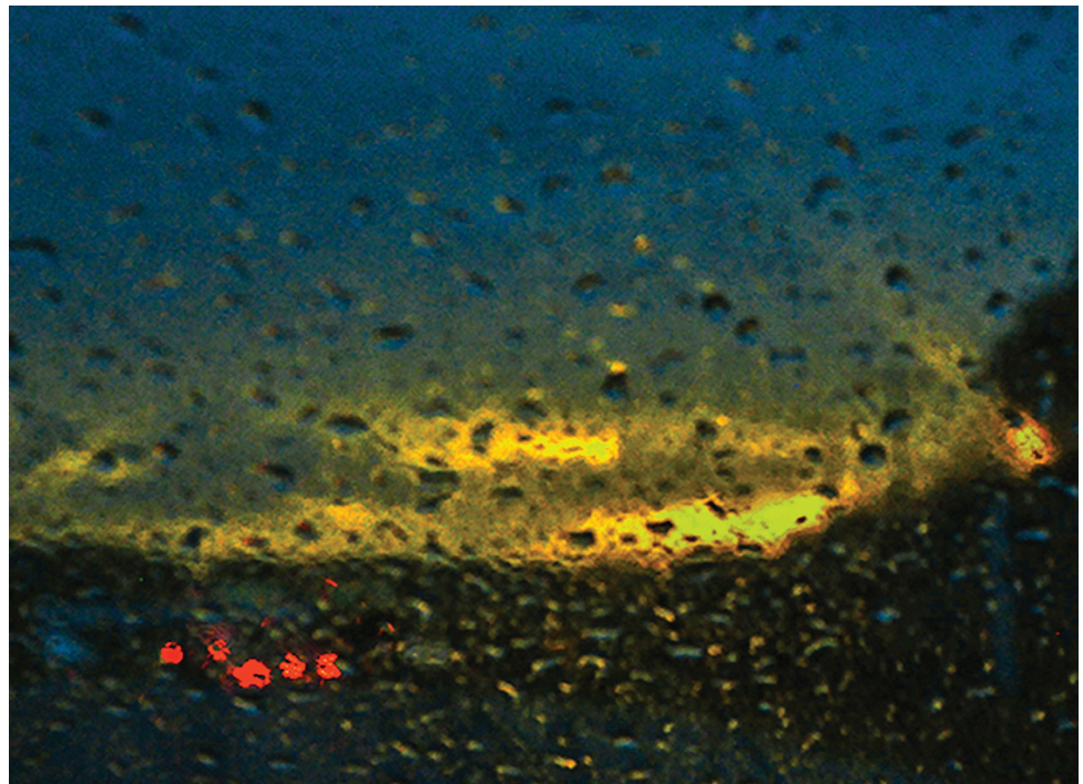
El camino extraño.