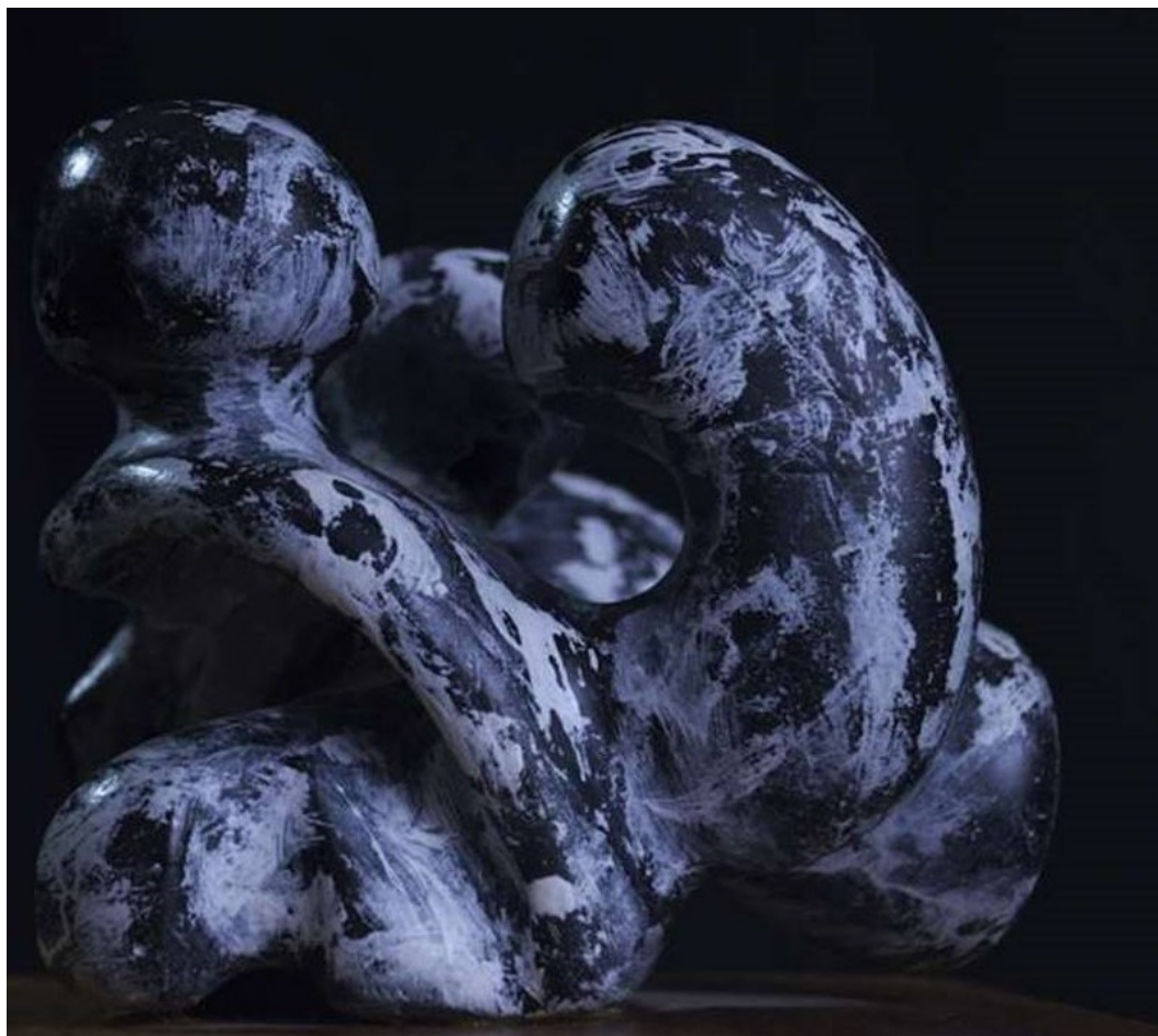
“Cóncavo y convexo”