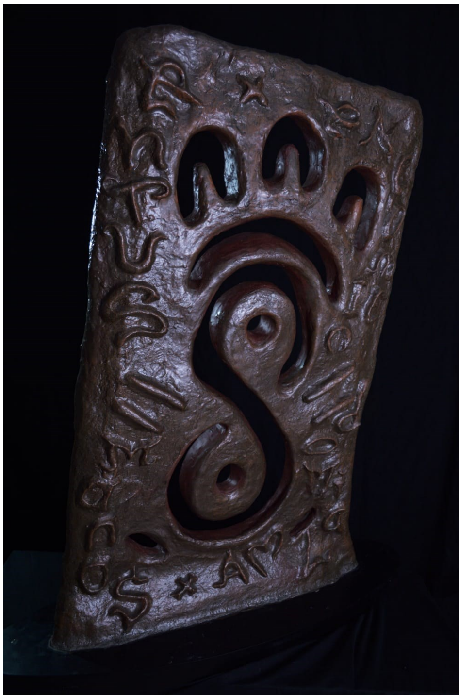
“Desde la nada”