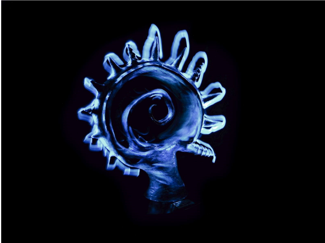
“Caracoles y Nebulosas”