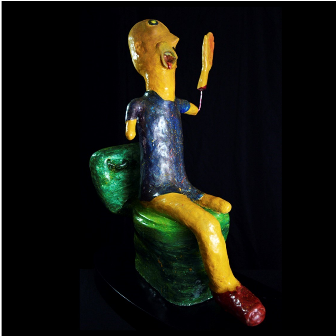
“Mom I Done”