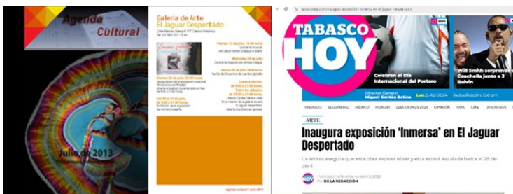
Imagen 3. Cuentan con la difusión de la agenda en su página Web oficial y con el apoyo de medios impresos locales con sección cultural.

como lo pueden ser el nombre de la actividad, nombre de los expositores, conferencistas, escritores entre otros, el horario de la actividad, de igual forma el costo de la entrada que es de forma gratuita y para todo el público.