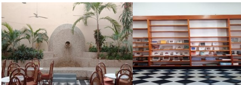
Imagen 1. Cafetería y librería de la galería El Jaguar Despertado (Fuente: Donovan Javier, 2023).

El objetivo de este espacio galerístico es ofrecer exhibiciones de artistas locales y nacionales e internacionales con el fin de promover las artes pictóricas, fotográficas y escultóricas de la época actual.