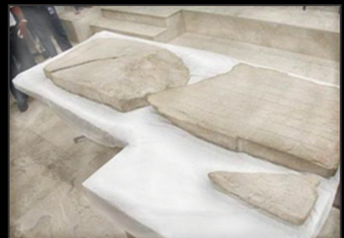
Estela número 6.

Esto es lo que dicen los expertos de la estela número 6 del Tortuguero, pero las profecías mayas también revelan acontecimientos impactantes, por ejemplo en el libro de las profecías, el Chilam-Balam de Chumayel se plantea que en la Tierra prevalecerá la perdición, la miseria, la codicia y