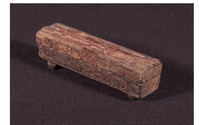
Figura 3) Caja de madera que contenía agujas de manta raya labradas. Proporcionada por el arqlogo. Alfonso Arellano.