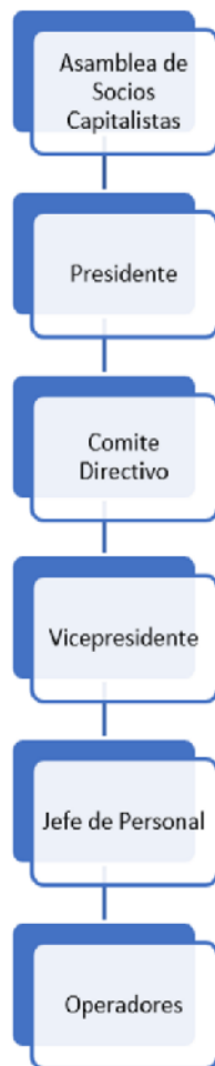
Figura 3. Estructura Administrativa Conformada como Sociedad Anónima.

Por último, en la Figura 3, la estructura de empresa, en la que sus socios operadores terminan por separarse y alejarse de su representante, debido a que, en la asamblea de socios, solo se encuentran los socios administradores, siendo los privilegiados en obtener la categoría de socios capitalistas y los socios operadores se convierten en empleados.