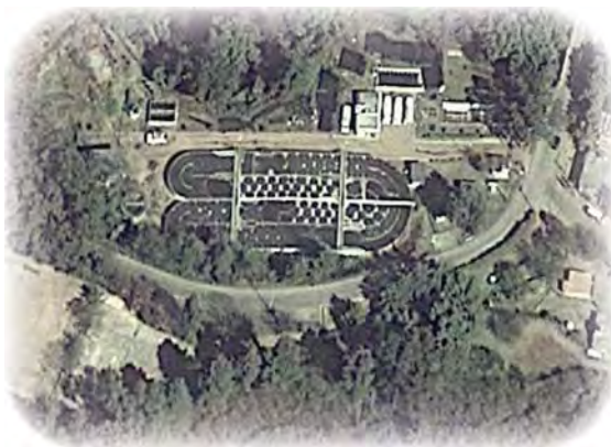
Zanja en «U» (Tenancingo, Estado de México).