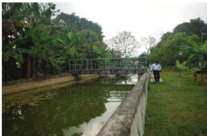
Fotografía 1. Zanja de oxidación de Villa Estación Chontalpa, (Huimanguillo, Tabasco).