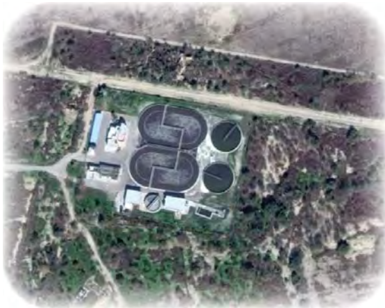
Zanja tipo carrusel (Piedras Negras, Coahuila).