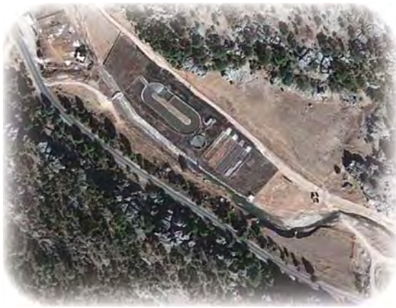
Zanja con pared isla (Creel, Chihuahua).