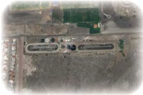
Zanja doble canal sin pared isla (El Campanario, Querétaro).