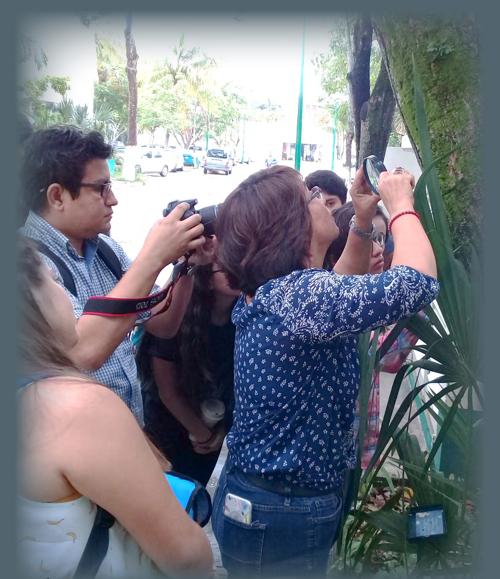
PRÁCTICAS DE CAMPO EN LA ASIGNATURA «ALGAS Y BRIOFITAS» DENTRO DE LAS INSTALACIONES DE LA DACBiol. División Académica de Ciencias Biológicas (DACBiol); Universidad Juárez Autónoma de Tabasco (UJAT). Villahermosa, Tabasco; México.