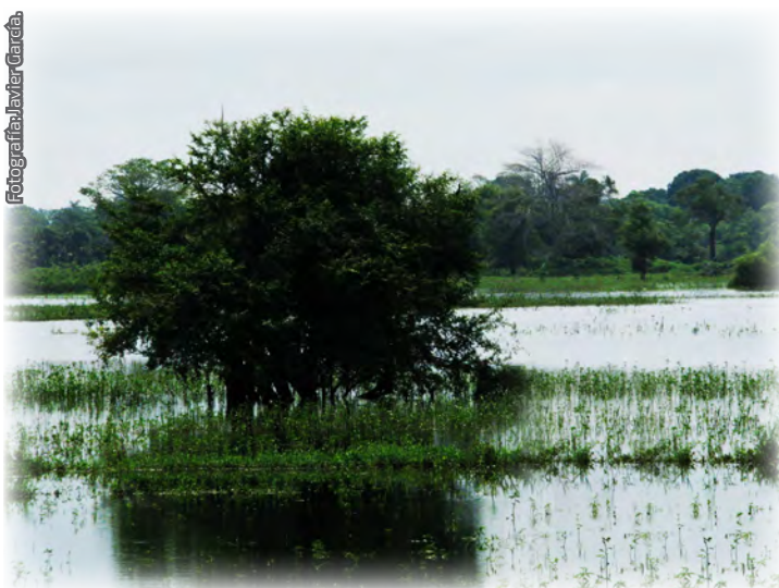
Fotografía 8. Típicos terrenos inundables; (Centro, Tabasco).

De manera específica, se perdió el 60 % de la superficie de humedales, colocando a Tabasco en una de las zonas que resalta por la mayor pérdida a nivel nacional (Landgrave & Moreno-Casasola, 2012).