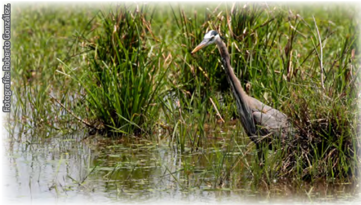
Fotografía 7. Una garza morena ( Ardea herodias ) en pastizales inundables; (Macuspana, Tabasco).