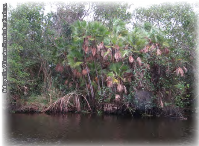
Fotografía 3. Tasistal (' Acoelorrhaphe wrightii '); (Centla, Tabasco).