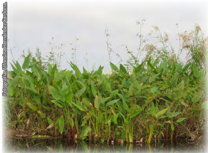
Fotografía 4. El popal (' Thalia geniculata ') forma una comunidad de hidrófitas enraizadas emergentes; (Centla, Tabasco).