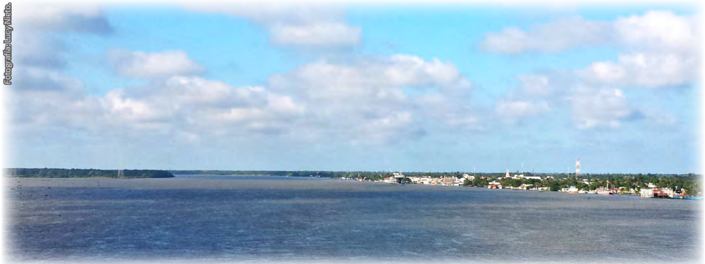
Fotografía 1. Río Usumacinta en su recorrido por Tabasco (Jonuta, Tabasco).

En la Ley de Aguas Nacionales, México define a los humedales como aquellas zonas de transición entre los ecosistemas acuáticos y terrestres, con inundación temporal o permanente, con o sin la influencia de las mareas, continentales o costero-marinos, con vegetación adaptada a la vida acuática y con un suelo predominantemente hídrico, e incluyen zonas cubiertas por aguas dulces, salobres o saladas, permanentes o temporales, estancadas o corrientes. Al existir una gran variedad de ellos, existen muchas definiciones y clasificaciones, por lo que los nombres que los humedales reciben son variados (Berlanga-Robles, Ruiz-Luna & De la Lanza-Espino, 2008).