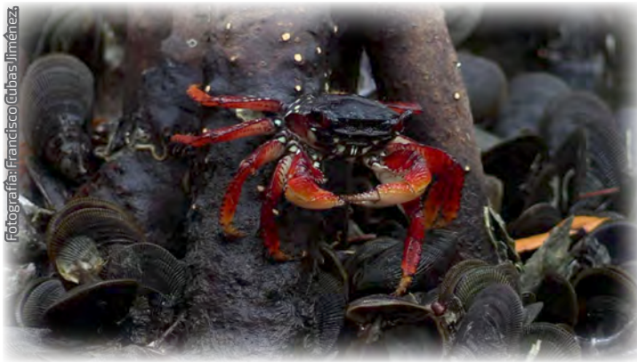
Fotografía 6. El cangrejo de pantano ( Goniopsis cruentata ) es un habitante de los manglares; (Paraíso, Tabasco).