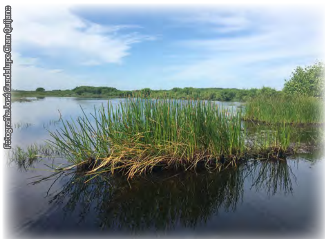
Fotografía 5. Los espadañales o tulares están dominados por el tule (' Thypha domingensis ' y ' T. latifolia '); (Cárdenas, Tabasco).

La fauna acuática de los humedales de Tabasco está representada por 611 especies, una cantidad mucho mayor que la de especies terrestres (Sánchez & Barba, 2005). Dentro de éstos destacan los artrópodos acuáticos, los moluscos y los peces (Sánchez & Barba, 2005; León & Trinidad, 2012) (fotografía 6).